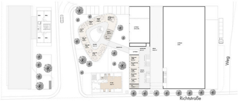
OG 1 M 1,200