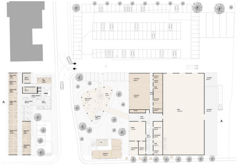
EG M 1,200